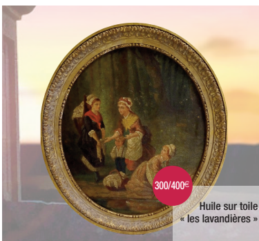
Huile sur toile « les lavandières »