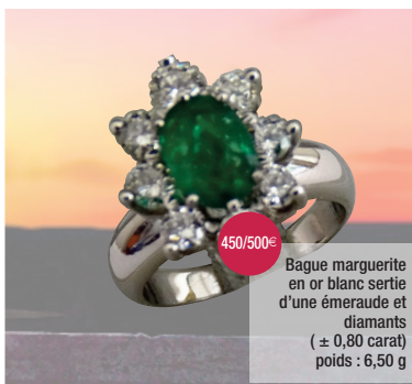
Bague marguerite en or blanc sertie d'une émeraude et diamants ( ± 0,80 carat) poids : 6,50 g