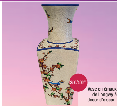
Vase en émaux de Longwy à décor d'oiseau.