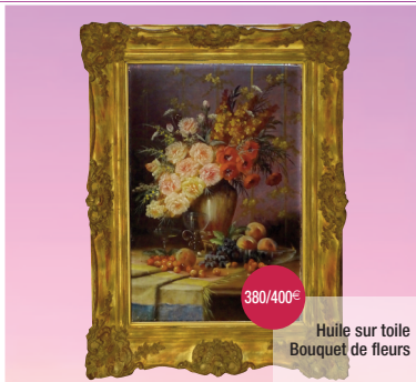
Huile sur toile Bouquet de fleurs