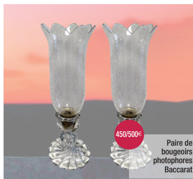
Paire de bougeoirs photophores Baccarat