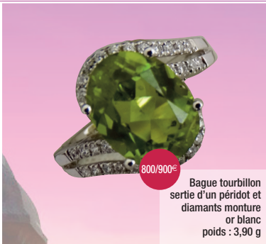
Bague tourbillon sertie d'un péridot et diamants monture or blanc poids : 3,90 g