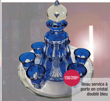
Beau service à porto en cristal doublé bleu