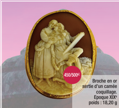
Broche en or sertie d'une camée coquillage. Epoque XIX e poids : 18,20 g